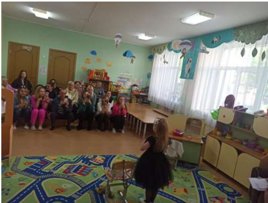
Изучение и закрепление дорожных знаков с помощью настольных игр