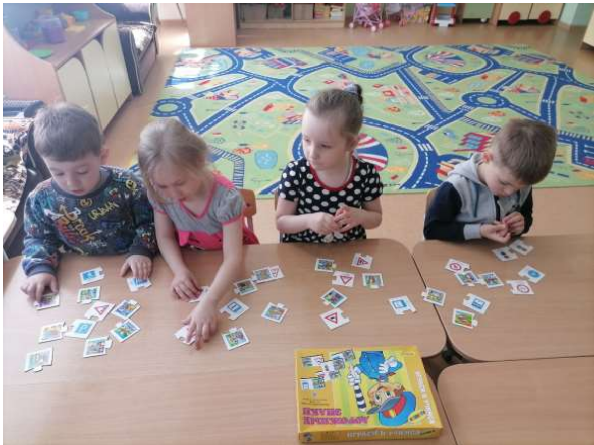
Родительские собрания с включением вопроса по нарушениям правил дорожного движения